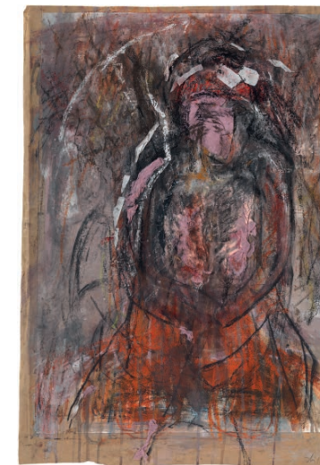
MADONNA , 2017 Gouache, Kreide, Collage auf Papier 61 × 41 cm