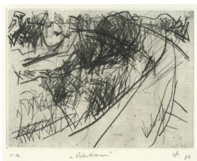
Oderdamm , 2006 Kaltnadelradierung (e. a., sign.) 14,8 × 19,8 cm