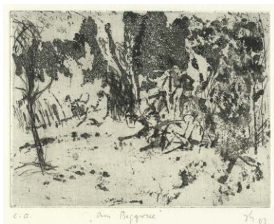
Am Baggersee , 2003 Kaltnadel/Aquatinta (e. a., sign.) 14,8 × 19,6 cm