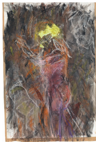
PONG , 2018 Gouache, Kreide, Collage auf Papier 58 × 38,3 cm