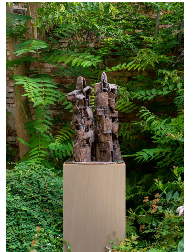
Zwei , 2001, Terrakotta 73,5 × 48 × 33 cm