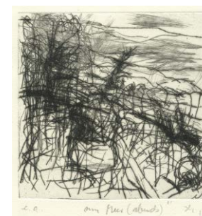
Am Meer (abends) , 2013 Kaltnadelradierung (e. a., sign.) 13,8 × 13,8 cm