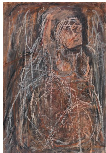
DIE BRAUT , 2016/2017 Gouache, Kreide auf Papier 56 × 39 cm