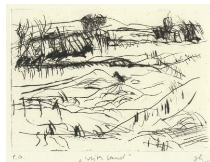
Weites Land , 2006 Kaltnadelradierung (e. a., sign.) 14,8 × 20,8 cm