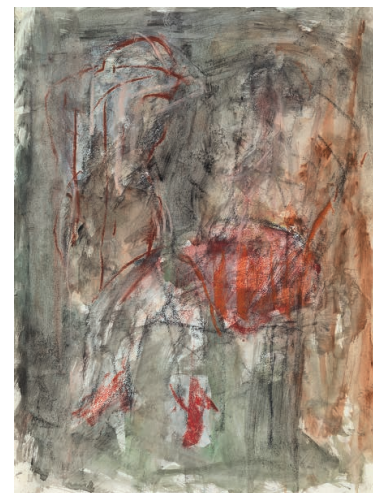
RED SHOES , 2018 Gouache, Kreide auf Papier 57,3 × 43,6 cm