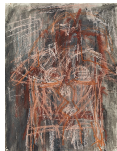
DAS KORSETT , 2017 Gouache, Tusche auf Papier 56,5 × 44,4 cm