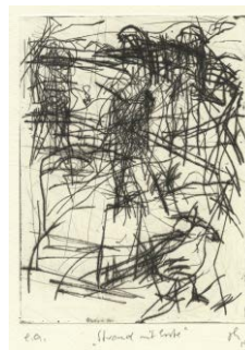
Strand mit Ente , 2015 Kaltnadelradierung (e. a., sign.) 14,7 × 11 cm