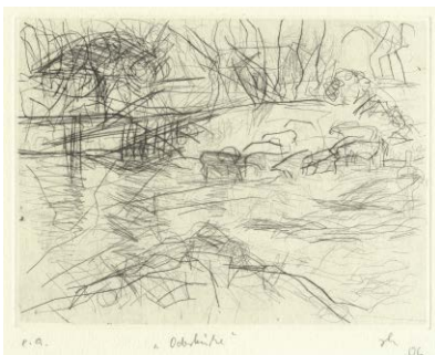
Oderkühe , 2006 Kaltnadelradierung (e. a., sign.) 15 × 19,9 cm