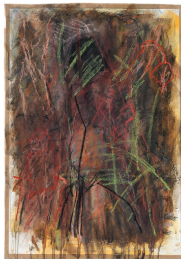
PINK , 2018 Gouache, Kreide, Collage auf Papier 59,5 × 41,4 cm