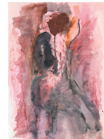
AM ABEND , 2017 Gouache, Tusche auf Papier 55,3 × 40 cm