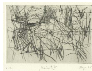
Kienitz IV , 2008 Kaltnadelradierung (e. a., sign.) 10 × 14,9 cm